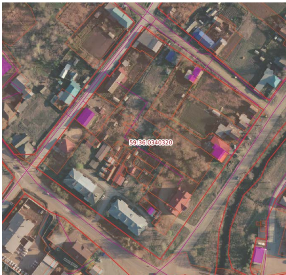
Рисунок 2 – Границы территории проектирования.

Рельеф площади относительно ровный. Граница проектируемой территории представлена на Рисунке 2.